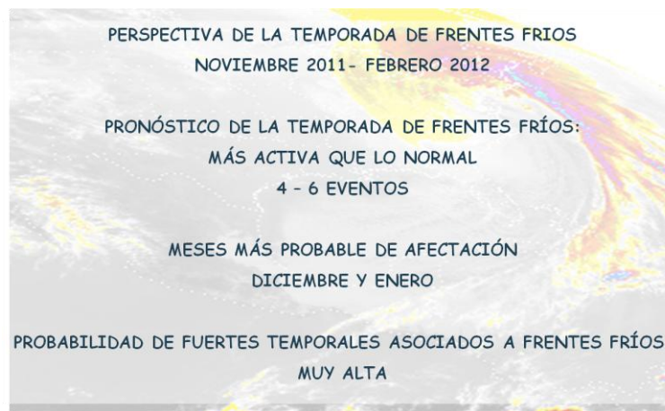
Figura 3. Perspectiva de la temporada de frentes fríos 2011-2012.