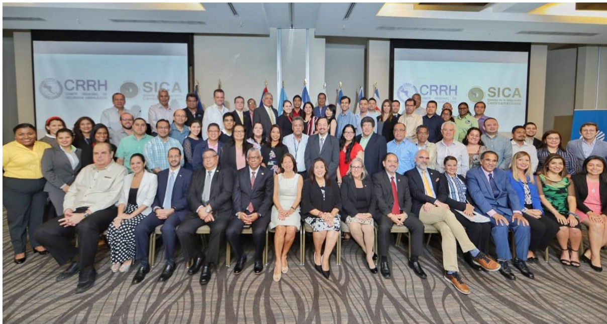
Figura 2. Grupo de trabajo que participó del LX Foro del Clima de América Central, Ciudad de Panamá, Panamá 2019.